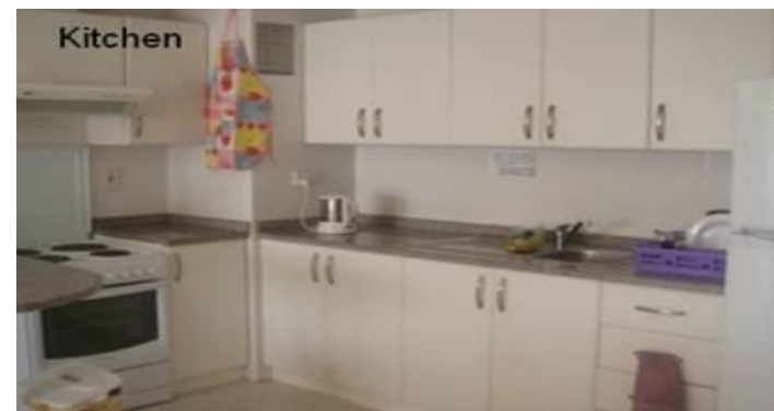
숙소 내부의 주방 모습