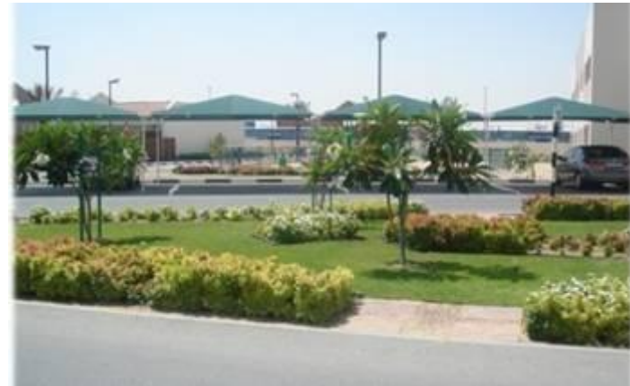
숙소가 구성되어 있는 마을 전경 버스정류장에서