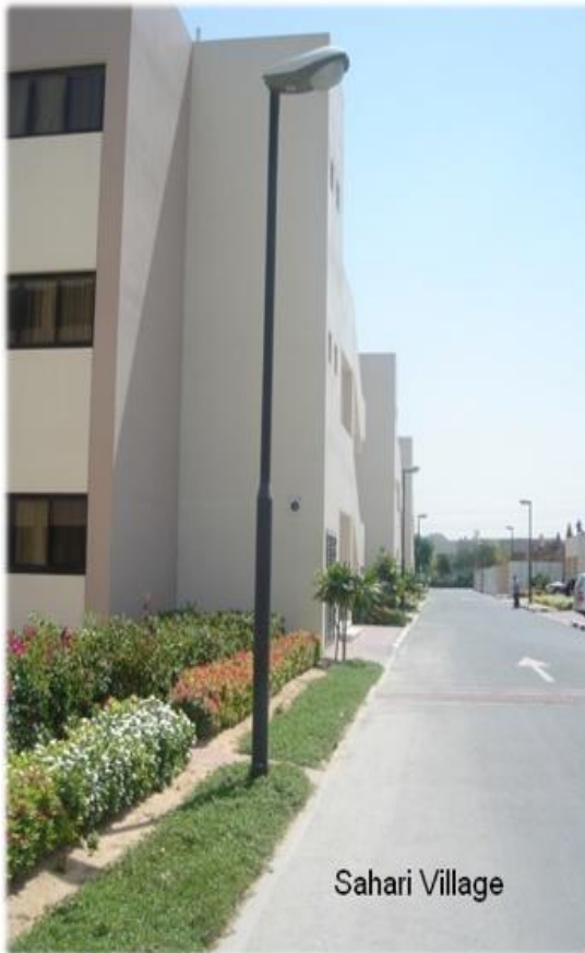
아파트형 숙소는 호텔에서 제공됨