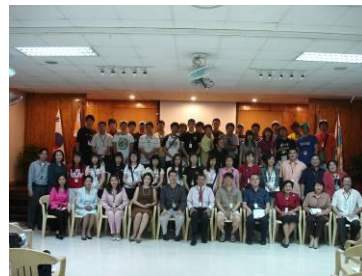
어학 연수 수료식